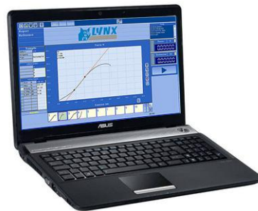
(con PC portátil Core i3 de 15")